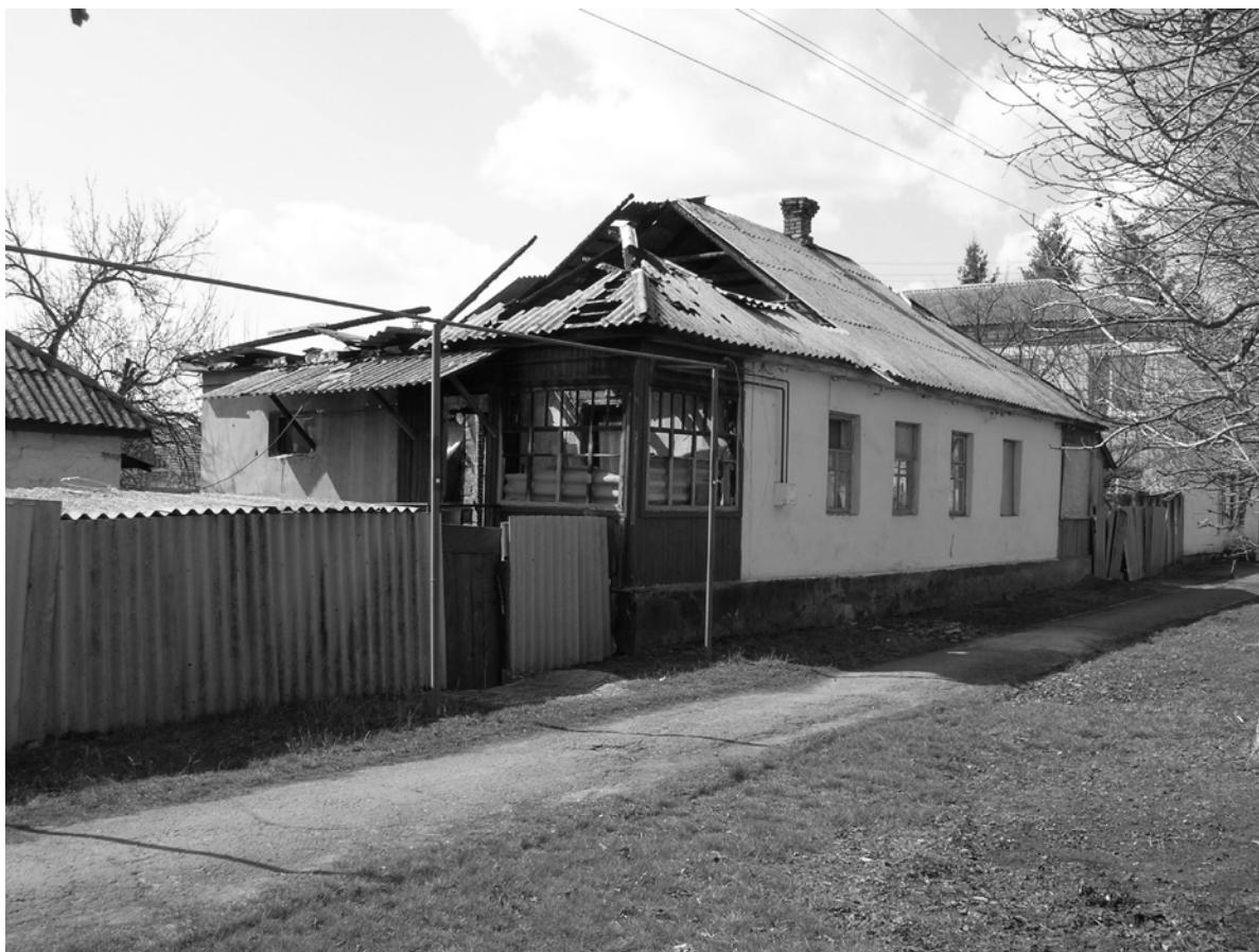
Рисунок 8 ул. Ленина, 23. Был разрушен в сентябре 2015 года.