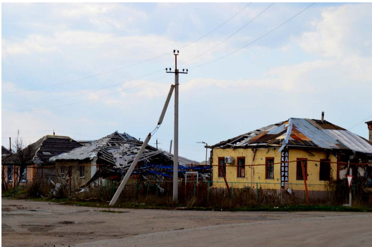
Рисунок 12 улица Москва – Донбасс