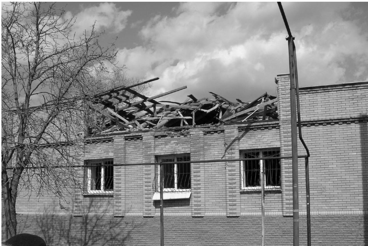
Рисунок 10 ул. Ленина, 10.