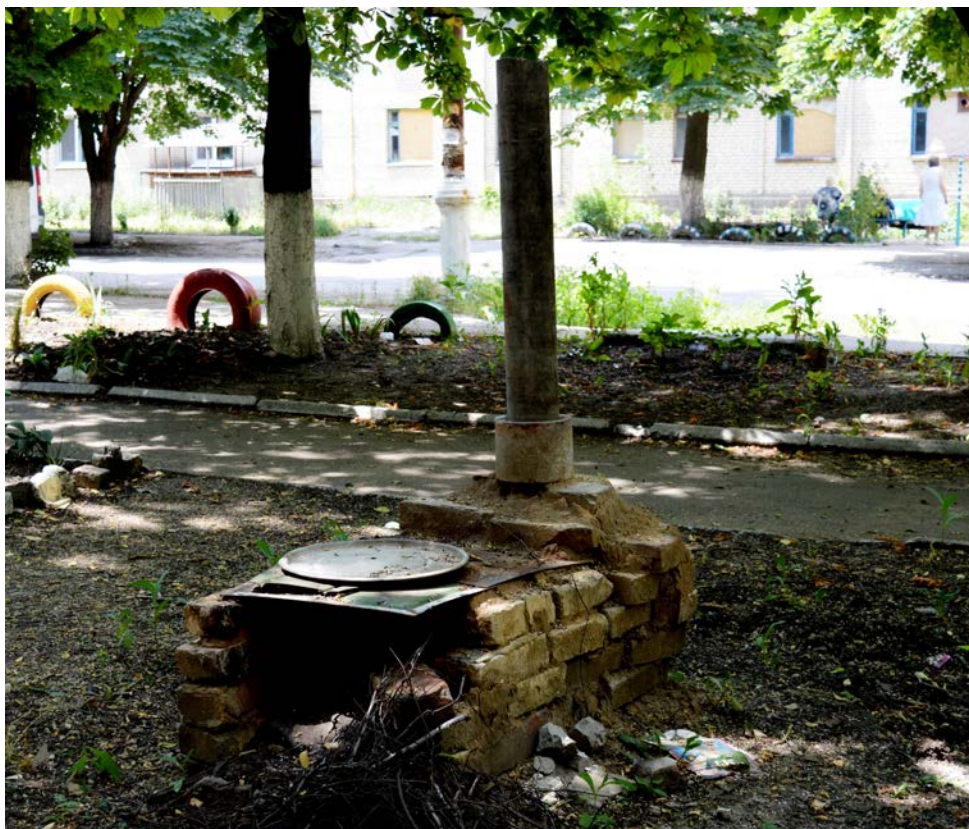
Рисунок 31: Буржуйка на улице. Тут же проходит приготовление еды.

По их словам, у них есть ощущение, что стреляют прямо из-под окон, приезжают, стреляют и уезжают. Но лично стреляющую технику они не видели. По словам других участников разговора, из жилого сектора, с территории завода стреляли раньше, теперь не стреляют. Жители утверждают, что в ответ на соответствующие жалобы комендант ссылается на неподконтрольные подразделения и, одновременно, требует не распространять дезинформацию.