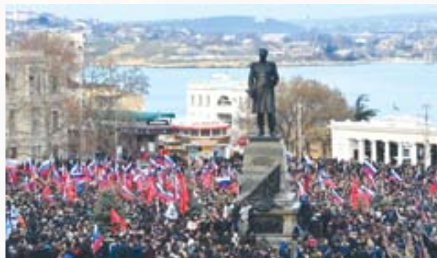
Мітинг «Русская весна»

чали появу озброєних груп без пізнавальних знаків; звучали заклики до мобілізації та захоплення влади. З'явилися електронні ЗМІ, які дають щоденну «картину» подій в регіоні; було оголошено про початок проекту «Російська весна» 9 .