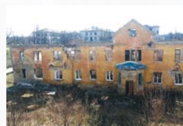
Зруйнована в результаті обстрілів лікарня в Семенівці під Слов'янськом

комунальної власності, 24 об'єкти приватного сектора, зруйнований міст через річку Казенний Торець на трасі М-03. Головні підрозділи НЗФ вийшли з міста 4 липня 2014 року у напрямку через Костянтинівку до Горловки, ЗЗФ остаточно взяли під контроль місто 5 липня.