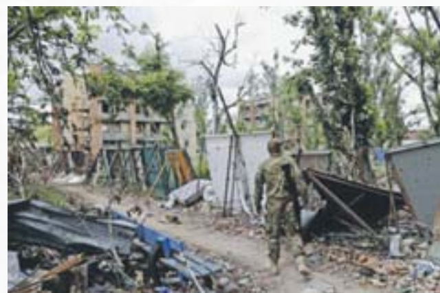
Широкине після боїв

ним та Центральним, Міусом та Фащівкою, між Нікішиним та Кумшацьким, між Вільхуваткою та Малоорлівкою, Булавінським та Юнокомунарівськом, між Вуглегорськом та Єнакієвом, між Молочним та Гурти (Дебальцевський плацдарм), між Новолуганським та Гольмівським, між Бахмуткою та Зайцевом, Майорськом та Микитівкою, між Південним та Горлівкою, між Новгородським та Широкою Балкою, між Верхньоторецьком та Пантелеймонівкою, між Авдіївкою та Ясинуватою, між с. Опитне та с. Спартак, між с. Піски та Куйбишевським районом Донецька, між Красногорівкою та Старомихайлівкою, між Мар'їнкою та Олександрівкою, між с. Тарамчук та Оленівкою, між Новотроїцьким та Докучаєвськом, між Миколаєвкою та Силою, Богданівкою та Петровським, Старогнатівкою та Білою Кам'янкою, виходячи перед с. Гранітне до річки Кальміус і далі по руслу річки на південь повз Гранітного, Чермалика до Павлопольського водосховища, далі по суші між с. Пищевік та Верхнєшироківським, між селами Пікузи та Заїченко, між Водяним та Саханкою, впираючись в берег Азовського моря в с. Широкине 37 .