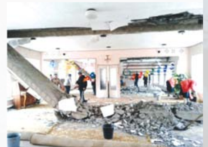
Зруйнований дитячий садок «Надія» у Кіровську

7 лютого 2015 року о 10 годині 30 хвилин в результаті артобстрілу відбулося пряме попадання снаряда в дах, в результаті чого було зруйновано 9-ти метрове бетонне перекриття в музичному залі і пошкоджено будівлю газової котельні.