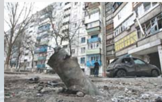
Квартал Східний у Маріуполі після обстрілу

24 січня 2015 року місто було обстріляне НЗФ з РСЗВ «Град», головний удар прийшовся по мікрорайону «Східний», загинула 31 людина, поранено щонайменше 93 осіб.