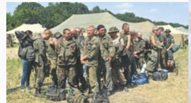
ЗСУ та прикордонники були змушені відступити в РФ з ПП «Ізварине»

4 серпня група з 438 українських силовиків (274 військовослужбовців 72-ї механізованої бригади та 164 прикордонника) без зброї з гуманітарного коридору перейшли на територію РФ. Російські ЗМІ повідомили, що військовослужбовці звернулися до Росії з проханням про надання притулку. Українські ЗМІ вказували, що військовослужбовці були змушені відступити на територію Росії в зв'язку з вичерпанням боєприпасів та неможливістю продовжувати бойові дії, проте вони не змінювали присяги та не просили сховища 30 . Частина бійців зі складу 72-ї механізованої бригади вирішила прориватися до основних підрозділів української армії через коридор у Маринівку, за який майже безперервно йшли бої.