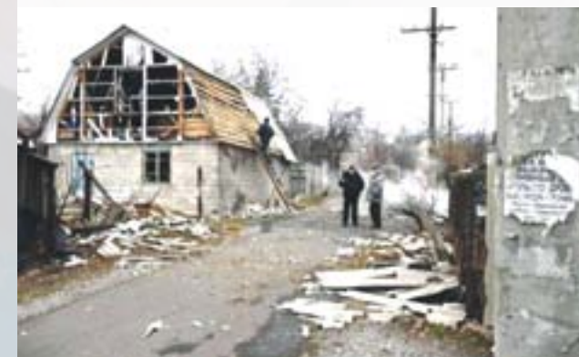
Тошківка після обстрілу

У другій половині листопада 2014 року підрозділи ЗСУ зайняли селище. Протягом декількох днів між ЗСУ та НЗФ т. зв. «ЛНР» (в селищі Ореховому) здійснювалися вогневі контакти. 18 листопада НЗФ т. зв. «ЛНР» завдали ракетного удару по селищу з РСЗВ «Град». Загибло 5 цивільних, і ще 8 отримали поранення. Зруйновано щонайменше 11 будинків.