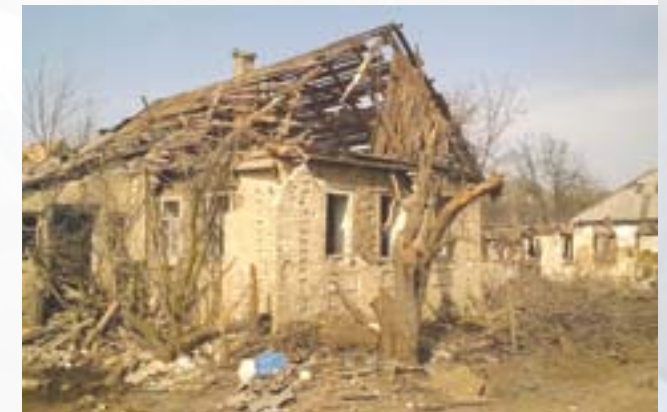
Село Зайцеве після систематичних обстрілів

Географічно вони знаходилися в тактично невигідному положенні — в низинах; «замкнені» для наскрізного переміщення; продивляються з позицій противника; і т. п. У зв'язку з чим, появу таких повідомлень варто розглядати як «повідомлення політичної необхідності», без зміни фактичного статусу контролю над НП і зміною лінії контролю територій.