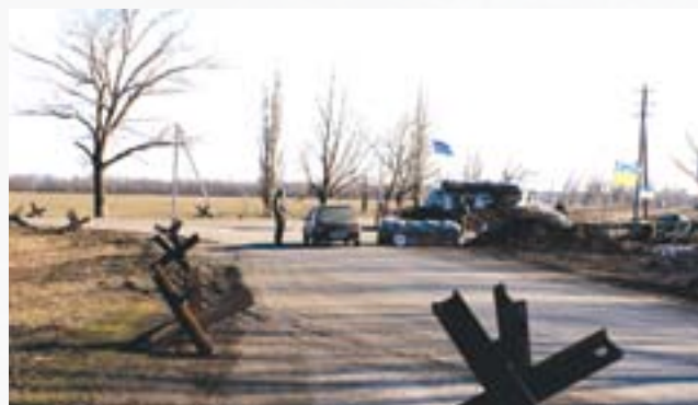
Блокпост біля Бахмуту

Місто знаходилося під контролем НЗФ з початку квітня до 5 липня 2014 року. У червні 2014 року бойовики НЗФ намагалися штурмувати військову частину, що розміщується посеред міста, декілька житлових будинків було пошкоджено обстрілами. 27 червня озброєні люди розстріляли рейсовий автобус. У результаті загинули двоє людей — водій автобуса та жінка-пасажир, яка померла від тяжких поранень у лікарні.