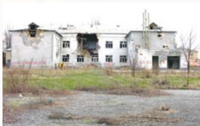
Зруйнований Будинок культури в Лисичанську

поверхових будинків. Також було пошкоджено 47 об'єктів інфраструктури та об'єктів промислового значення. ХПГ має дані щодо 8 цивільних осіб, що загинули внаслідок ведення бойових дій. Відомо про щонайменше 7 цивільних поранених, але місцеві мешканці повідомляють що у період з липня по серпень кількість поранених могла перевищувати 25 чоловік. У липні 2014 року був підірваний міст з Лисичанська на Сєвєродонецьк через селище Павлоград.