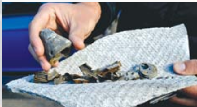
Мар'їнка. Уламки зброї зібрані після обстрілу житлового будинку

ЗСУ розміщуються в житлових кварталах міста. Бойові дії ведуться в міській смузі. Обстріли житлових кварталів міста трапляються щонеділі або й частіше.