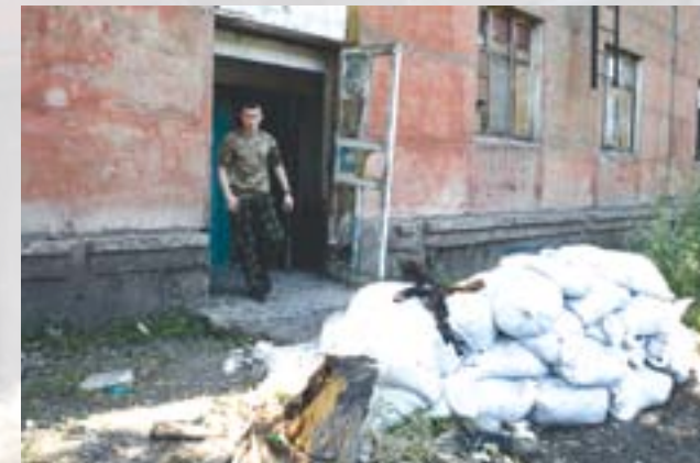
Золоте-4. ЗСУ зайняли в своїх цілях житловий багатоквартирний дім

Дистанція між укріпленнями сторін конфлікту поблизу ряду НП іноді звужується до кількох сотень метрів. Ведення бойових дій в умовах щільної міської забудови, несе величезні ризики для цивільного населення, що з різних причин не виїхали зі своїх будинків. У такій ситуації велике значення має самодисципліна військовослужбовців і контроль командування над їхніми діями.