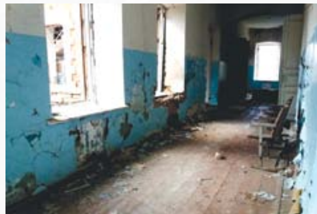
Лікарня в Верхньоторецькому, знищена обстрілами

Селище поділене на дві зони контролю — ЗСУ і НЗФ т. зв. ДНР. Обстріли ведуться у тому числі і з житлових масивів. Жителі неодноразово протестували проти розміщення ЗСУ в житлових масивах. ЗСУ з місцевими жителями поведуться досить жорстко. Вкрай обмежений пропуск місцевих мешканців навіть у межах селища. Місцеві мешканці повідомляли моніторам ХПГ про те, що у 2016 році проїзд транспорту та доставку продовольства на деякий час було обмежено військовослужбовцями у зв'язку з невизначеністю контролю території селища сторонами конфлікту. Деякий час мешканці селища мали змогу перетинати ЛЗ (посеред села по вулиці Миру знаходиться БП) та мали змогу дістатися до місця роботи на непідконтрольних територіях. З 2017 року такої можливості вони були позбавлені, їм було запропоновано перетинати лінію зіткнення в офіційних пунктах в'їзду-виїзду через ЛЗ, а це унеможливило розумні строки перетинання ЛЗ (найближчий перехід можливий або в 100 км північніше через КПВВ «Майорське», або південніше на 90 км у КПВВ «Мар'їнка»).