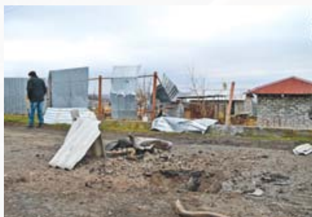
Новолуганське після обстрілу 18 грудня 2017 року

Перший обстріл Новолуганського був у серпні 2014 року. Під час обстрілу селища в 2014 році були поранені двоє цивільних і один загинув.