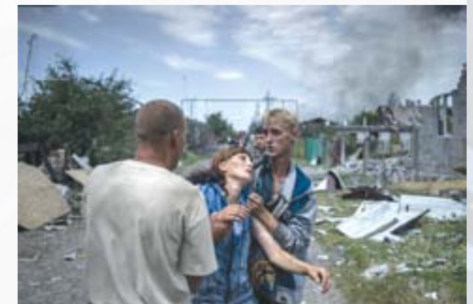
Станція Луганська після авіаудару 2 липня 2014 року

Території, контрольовані НЗФ в Донецькій області за станом на кінець серпня 2014 року — не менш 7,8 тис. км 2 (з 26,5 тис. км 2 загальної площі області), з населенням — не менш 2,5 млн. осіб; в Луганській області — не менш 11,4 тис. км 2 (з 26,7 тис. км 2 загальної площі області), з населенням не менш 1,45 млн. осіб.