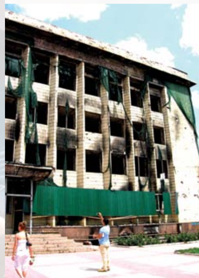
Торецьк. Будівля міськради спалена під час наступу

У період з липня 2014 по грудень 2015 років в селищі було зруйновано або пошкоджено не менше 200 об'єктів житлового фонду, в період з січня 2016 по березень 2017 — не менше 90. Пошкоджень інфраструктури не фіксувалося.