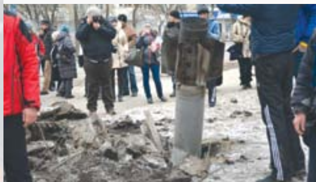
Краматорськ після обстрілу 10 лютого 2015 року

10 лютого 2015 року по Краматорську було завдано ракетного удару РСЗВ «Град». Загинуло 15 осіб, 47 отримали поранення 4 .