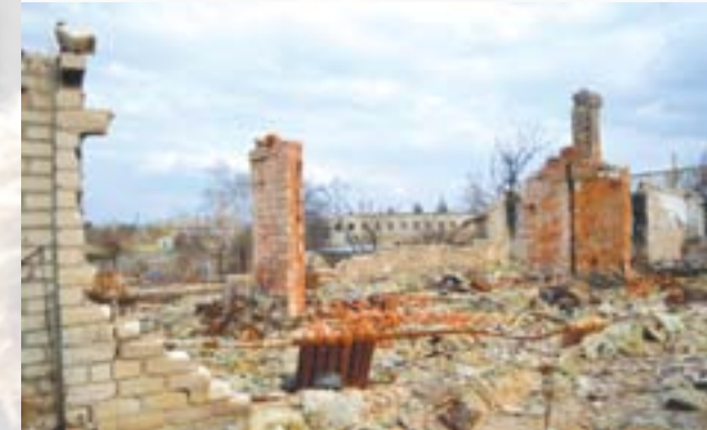
Залишки житлового будинку по вулиці Островського після авіаудару

розцінювати інакше, як спробу дезінформації. Удари по станицях Луганська та Стара Кондрашевська не можуть бути виправдані ніякими міркуваннями військової необхідності. Вони явно суперечать нормам міжнародного гуманітарного права, такі дії є злочином...»