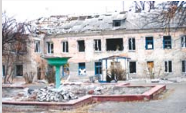
Новосвітлівка. Центральна лікарня після обстрілів в 2014 році

щі були зруйновані школа-гімназія, клуб, Будинок культури, лікарня, дитячий садок, селищна рада, щонайменше 82 домогосподарств. На протязі серпня 2014 року загинули щонайменше 33 місцевих мешканця, щонайменше 103 зазнали поранень.