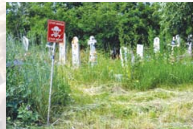
Заміноване кладовище біля Золото-4

Зростала кількість випадків, коли сторони застосовували важке озброєння для обстрілів позицій один одного, в тому числі — обстрілів житлових кварталів НП. Сторони почали реалізацію мінно-загороджувальних дій з метою формування зон безпеки, однак це призвело до зростання жертв серед цивільного населення, які продовжували користуватися місцевими дорогами і стежками для переміщення.