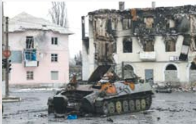
Вуглегірськ після обстрілів

У січні 2015 року НЗФ т. зв. ДНР почали систематичні обстріли Вуглегірська. 2 лютого 2015 року місто перейшло під контроль НЗФ т. зв. ДНР. Під час бойових дій місцеві мешканці масово залишали місто. Повідомлялось про те, що щонайменше дві тисячі цивільних осіб пішки покинули місто та направилися до міста Дебальцеве, з метою покинути місце бойових дій.