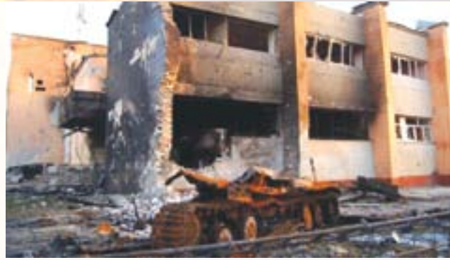
Зруйнований ДК в Новосвітловці

З 13 серпня ЗСУ взяло під контроль Новосвітлівку та Хрящувате 32 .