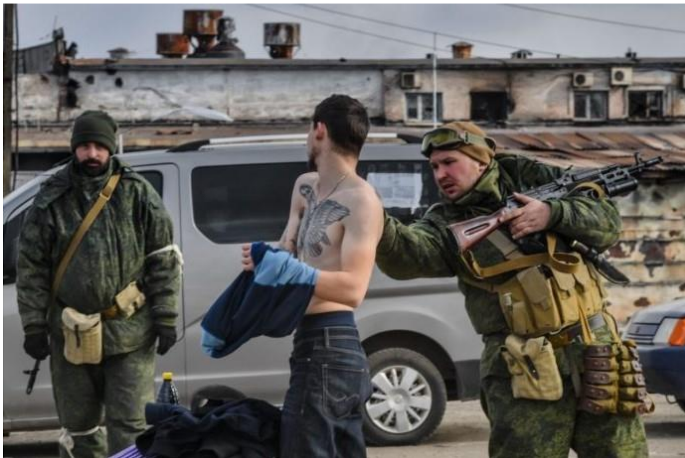
Российские военные проверяют мужчину на одном из блокпостов.

Те, кто прошел первый этап фильтрации, получают справку небольшого размера, на которой указаны фамилия, имя и отчество, дата рождения, печать с надписью “Дактилоскопирован”, названием фильтрационного пункта, датой и подписью лица, производившего фильтрацию. Фамилия этого человека не указывается. Эта “справка” является пропуском на всех оккупированных территориях, с ней также можно въехать на территорию РФ, ее нужно предъявлять при каждой проверке вместе с паспортом. Но и она может не спасти от повторной процедуры проверки телефона, багажа, тела и т.д.